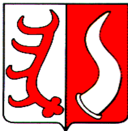
Rys . Herb Ręczajskich i Skulskich Rogala.