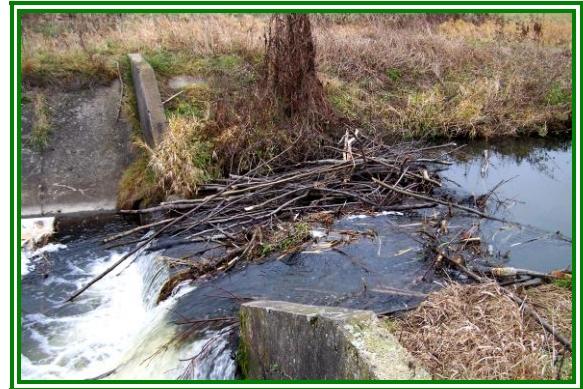
Fot. Koryto rzeki Rządzy

Walory przyrodnicze sprawiają, że wieś może stanowić bazę agroturystyczną. Rolniczy krajobraz Cygowa cechuje niewielkie zróżnicowanie rzeźby terenu. Te jednostki krajobrazowe otaczają tereny zabudowy jednorodzinnej i zagrodowej, które wspomagają strukturę przyrodniczą miejscowości.