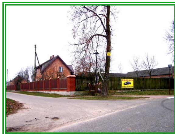
Fot. Przydrożne krzyże położone wśród dróg Cygowa.

W miejscowości kultywowane są tradycje i obrzędy lokalne. Z biegiem lat zmieniają swój przebieg i formę ale niezmiennie są związane z obchodami świąt kościelnych, uroczystościami rodzinnymi takimi jak śluby, chrzty, pierwsze komunie święte, bierzmowania, pogrzeby.