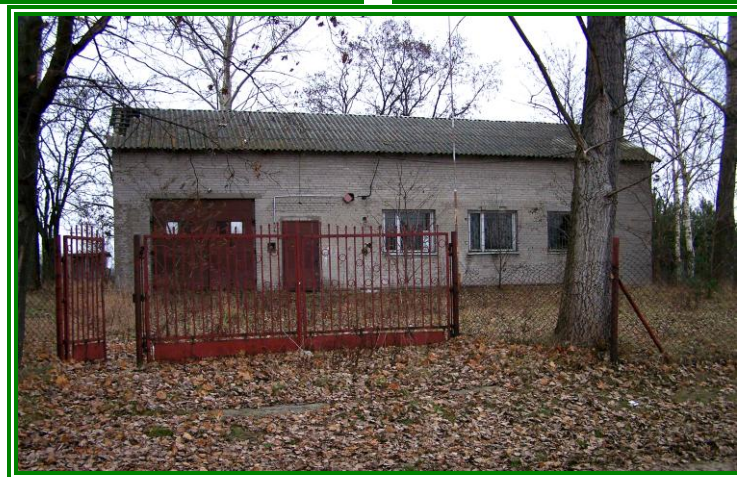
Fot. Budynek po dawnej strażnicy Ochotniczej Straży Pożarnej w Cygowie.