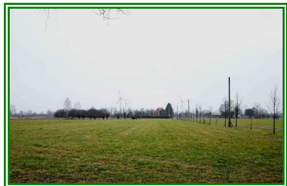
Fot. Typowy rolniczy charakter okolic Cygowa