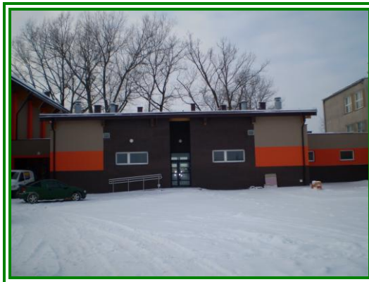
Fot. Sala gimnastyczna przy Szkole Podstawowej i Gimnazjum.

Zapotrzebowanie na boiska sportowe jest znaczne, ponieważ w gminie funkcjonuje 6 szkół podstawowych i 1 gimnazjum a istniejące boiska przyszkolne są nieutwardzone.