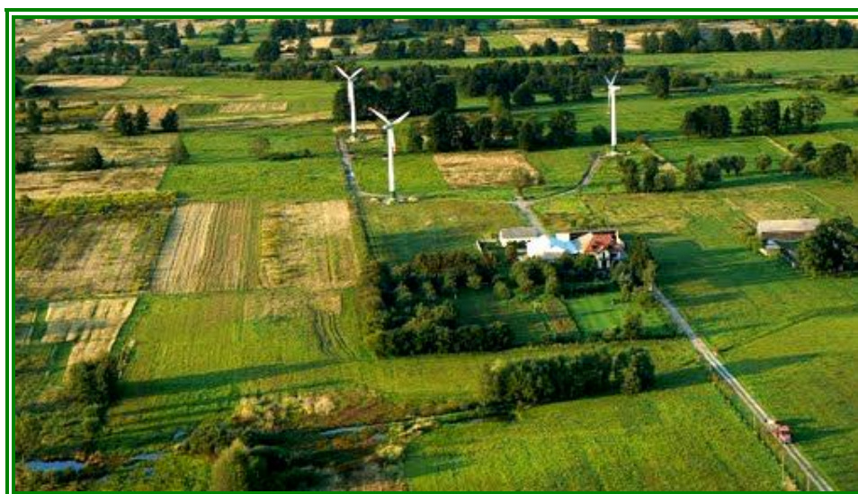
Fot. Elektrownia wiatrowa - Pana Tomasza Tabora w Cygowie.