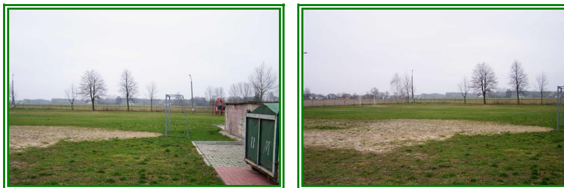
Fot. Obecny stan trawiastego boiska przyszkolnego

W 2007 roku Gmina wykonała modernizację i wyposażenie w sprzęt małego, trawiastego boiska przyszkolnego. Zamontowano 2 bramki do piłki ręcznej, z możliwością wykorzystania boiska do gry w piłkę nożną, jednak boisko to nie zaspakaja potrzeb ćwiczącej młodzieży. A największym utrudnieniem jest dbanie o murawę trawiastą, która przez intensywne użytkowanie ulega notorycznemu zniszczeniu.