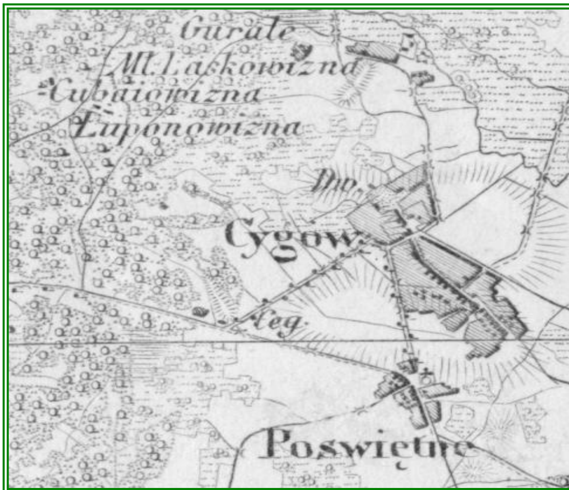
Rys. Okolice Cygowa w 1839 roku.

W pierwszej połowie XIX wieku dobra Cygów składały się z wsi: Cygów, Górale, Poświętne, Turze oraz licznych folwarków. W dobrach Cygów była gorzelnia i owczarnia „ starannie prowadzona ”. Po uwłaszczeniu ziemi dworskiej do dóbr Cygów należały folwarki: Cygów, Jadwinów, Laskowizna, Las Stróżka i Las Suchołąg. W Cygowie w czasie uwłaszczenia powstało 69 gospodarstw rolnych na 522 morgach ziemi. Cygów włączono do gminy Ręczaje. Dobra Cygów (2 071 mórg) zostały sprzedane za 100 000 rubli w 1868 roku.